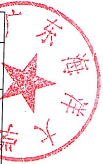
滨海农业学院推荐2024年优秀应届本科毕业生免试攻读研究生遴选工作情况公示表